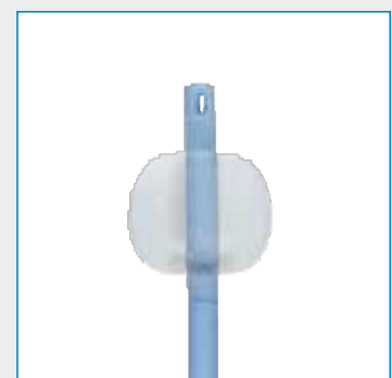
Ballonvolumen: 05-1D ml

–Verpackungseinheit: 10 Stück Verpackung: steril