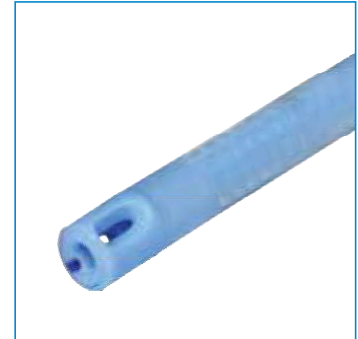
Zentral offene Spitze, integral Ballon